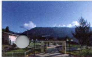
PARQUE PRINCIPAL DE KAÑARIS

Que, con el Decreto Supremo N° 043-2023-PCM, publicado el 26 de marzo de 2023, se declaró el Estado de Emergencia Nacional, por desastre de gran magnitud, a consecuencia de intensas precipitaciones pluviales en los departamentos de Lambayeque, Piura y Tumbes, por el plazo de sesenta (60) días calendario, para la ejecución de medidas y acciones de excepción, inmediatas y necesarias, de respuesta y rehabilitación que correspondan;