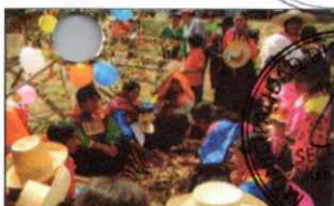
PARADA DE LA YUNZA