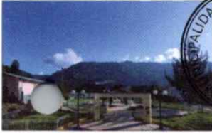
PARQUE PRINCIPAL DE KAÑARIS

ARTICULO TERCERO. - NOTIFICAR la publicación del presente acto resolutivo en el Portal Institucional de la Municipalidad Distrital de Cañaris.