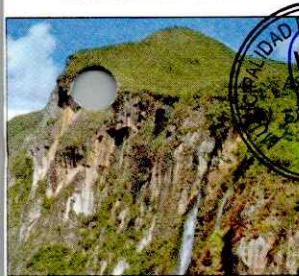
CATARATA EL CHORRO