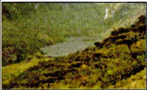
LAGUNA SHIN SHIN