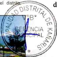
PARQUE PRINCIPAL DE KAÑARIS