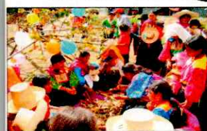
PARADA DE LA YUNZA