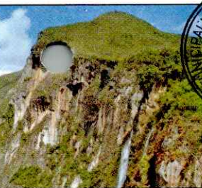
CATARATA EL CHORRO