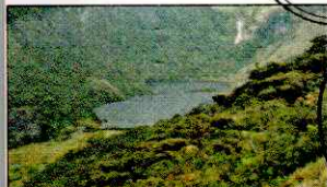
LAGUNA SHIN SHIN