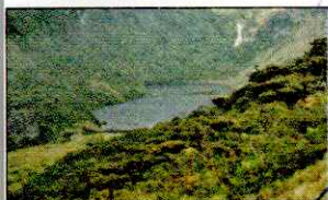
LAGUNA SHIN SHIN