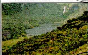
LAGUNA SHIN SHIN