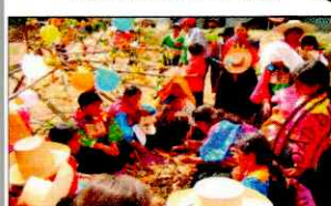
PARADA DE LA YUNZA