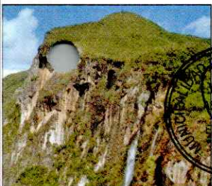
CATARATA EL CHORRO