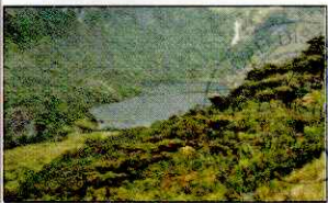
LAGUNA SHIN SHIN