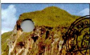
CATARATA EL CHORRO