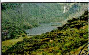
LAGUNA SHIN SHIN