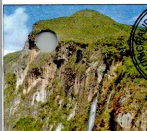
CATARATA EL CHORRO