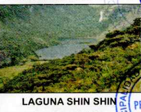
LAGUNA SHIN SHIN