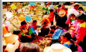
PARADA DE LA YUNZA