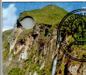
CATARATA EL CHORRO