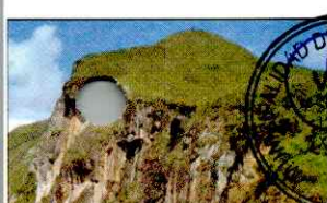
CATARATA EL CHORRO