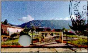
PARQUE PRINCIPAL DE KAÑARIS

Se confirma la consulta formulada por el proveedor, de conformidad del artículo 184 del reglamento de la Ley de contrataciones del Estado, y toda vez que el valor referencial de la obra es superior a cinco millones y 00/100 Soles (S/ 5 000 000,00), los términos de referencia han establecido lo siguiente: El otorgamiento de los adelantos directos y por materiales o insumos se puede otorgar a través de la constitución de fideicomisos, para lo cual no resulta necesaria la presentación de la garantía correspondiente. La aplicación de esta disposición se realiza de acuerdo a lo dispuesto en los artículos 184 y 185 del Decreto Supremo N° 344-2018-EF.