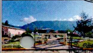
PARQUE PRINCIPAL DE KAÑARIS