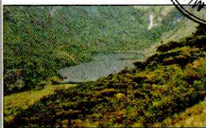
LAGUNA SHIN SHIN