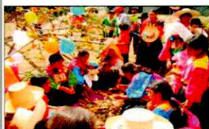
PARADA DE LA YUNZA