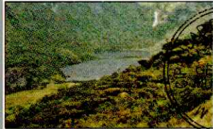
LAGUNA SHIN SHIN