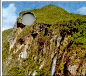
CATARATA EL CHORRO