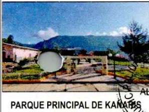
PARQUE PRINCIPAL DE KAÑARIS

Por las consideraciones expuestas y con las facultades conferidas en la Constitución Política del Perú y el numeral 6 del artículo 20° y 43° de la Ley N°27972, Ley Orgánica de Municipalidades;