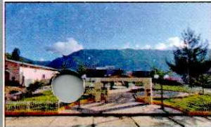
PARQUE PRINCIPAL DE KAÑARIS