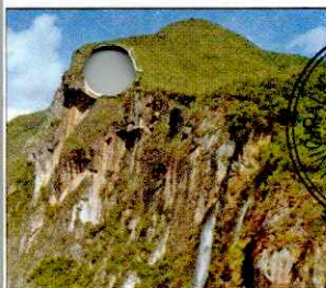
CATARATA EL CHORRO