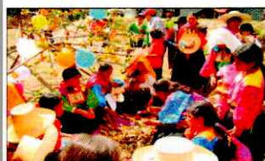
PARADA DE LA YUNZA