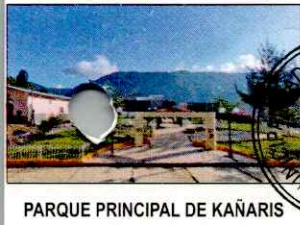
PARQUE PRINCIPAL DE KAÑARIS