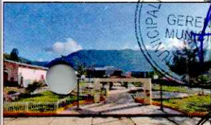
PARQUE PRINCIPAL DE KAÑARIS

ARTÍCULO TERCERO. - NOTIFICAR la publicación del presente acto resolutivo en el Portal Institucional de la Municipalidad Distrital de Kañaris.