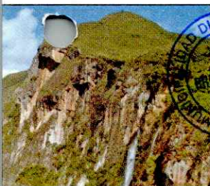
CATARATA EL CHORRO