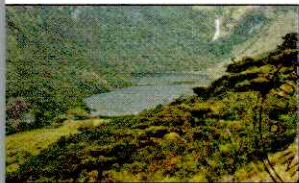
LAGUNA SHIN SHIN