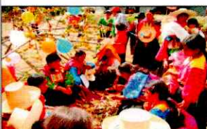
PARADA DE LA YUNZA

4.1 Administrar y reglamentar, directamente o por concesión el servicio de agua potable, alcantarillado y desagüe, limpieza pública y tratamiento de residuos sólidos, cuando esté en capacidad de hacerlo.