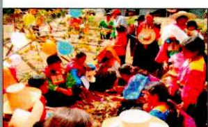
PARADA DE LA YUNZA