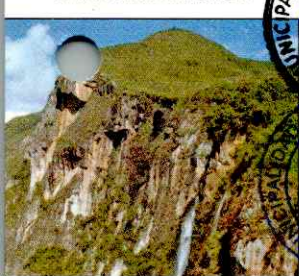
CATARATA EL CHORRO