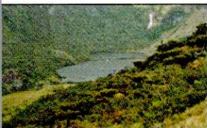
LAGUNA SHIN SHIN