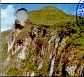
CATARATA EL CHORRO