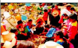
PARADA DE LA YUNZA

EL ALCALDE DE LA MUNICIPALIDAD DISTRITAL DE KAÑARIS, PROVINCIA DE FERREÑAFE, REGION DE LAMBAYEQUE