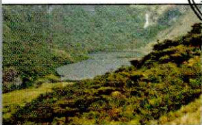
LAGUNA SHIN SHIN