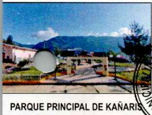
PARQUE PRINCIPAL DE KAÑARIS

82.- Las municipalidades, en materia de educación, ciencia, tecnología, innovación tecnológica, cultura, deportes y recreación, tienen como competencias y funciones específicas compartidas con el gobierno nacional y el gobierno regional las siguientes: