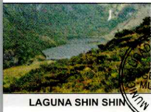
LAGUNA SHIN SHIN