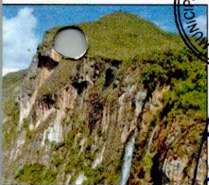
CATARATA EL CHORRO