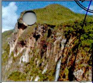
CATARATA EL CHORRO