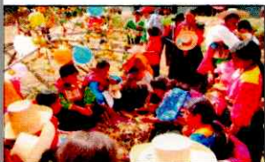
PARADA DE LA YUNZA