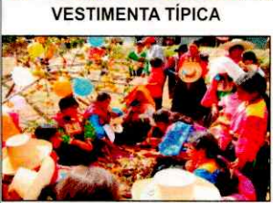
PARADA DE LA YUNZA