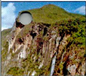
CATARATA EL CHORRO