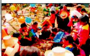
PARADA DE LA YUNZA