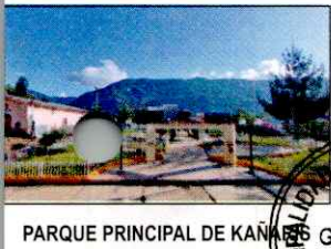
PARQUE PRINCIPAL DE KAÑARIS

ARTÍCULO CUARTO. - DISPONER , la publicación del presente acto resolutivo en el Portal Institucional de la Municipalidad Distrital de Kañaris.