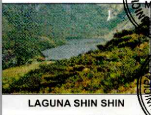
LAGUNA SHIN SHIN