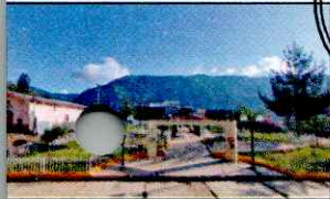
PARQUE PRINCIPAL DE KAÑARIS