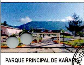
PARQUE PRINCIPAL DE KAÑARIS