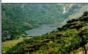
LAGUNA SHIN SHIN