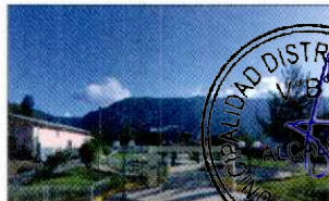
PARQUE PRINCIPAL DE KAÑARIS

PRESIDENTA DE CLUB DE MADRES DEL CASERÍO EL HUALTE