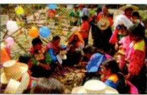
PARADA DE LA YUNZA