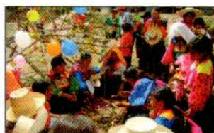
PARADA DE LA YUNZA