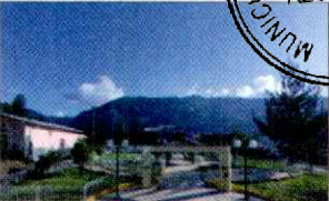
PARQUE PRINCIPAL DE KAÑARIS