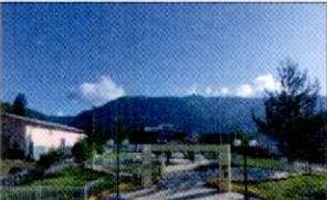
PARQUE PRINCIPAL DE KAÑARIS

Tengo el honor de dirigirme a usted para expresarle mi respetuoso y cordial, en calidad de Alcalde de la Municipalidad Distrital de Kañaris y, en atención al asunto del documento, EXTENDERLE LA INVITACION A LA DEGUSTACIÓN Y ELECCIÓN DE INSUMOS DEL PROGRAMA VASO DE LECHE DEL DISTRITO DE KAÑARIS, misma que se llevará a cabo el día viernes 27 de octubre de 2023 en el Palacio Municipal del distrito de Kañaris, a horas: 01:00 PM , con el objetivo de brindar un producto de calidad a los beneficiarios cumpliendo con los nutrientes respectivos, para mejorar la calidad de vida y estado nutricional de los niños y niñas.