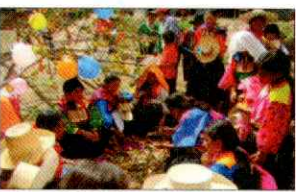
PARADA DE LA YUNZA