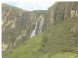
CATARATA "EL CHORRO" - KAÑARIS

Kañaris, trabajando por una vida digna y el buen vivir. Kañarispıqa, shumaq kawsaypaq imakunata ruranchik