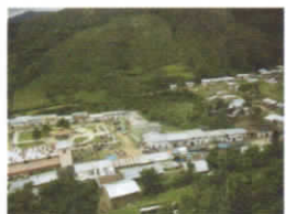
DISTRITO DE KAÑARIS

ARTICULO TERCERO.-ENCARGAR la Supervisión y Evaluación del PLAN OPERATIVO INSTITUCIONAL-POI 2017, a la oficina de Planeamiento y Presupuesto.