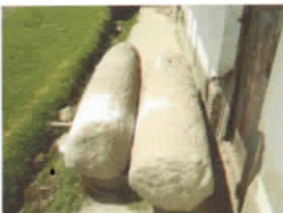
MONOLITO DE CONGONA