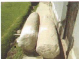
MONOLITO DE CONGONA