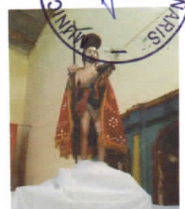
PATRON SAN JUAN BAUTISTA