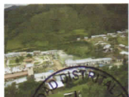
DISTRITO DE KAÑARIS