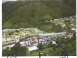
DISTRITO DE KAÑARIS ALCALDE