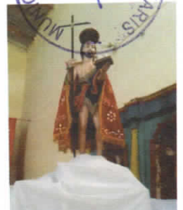
PATRON SAN JUAN BAUTISTA