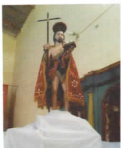
PATRON SAN JUAN BAUTISTA