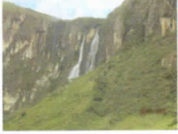
CATARATA "EL CHORRO" - KAÑARIS

Kañaris, trabajando por una vida digna y el buen vivir. Kañarispiqa, shumaq kawsaypaq imakunata ruranchik