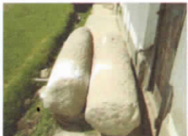
MONOLITO DE CONGONA